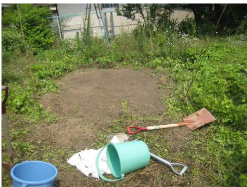
写真37 穴を掘ったときの出た、汚染されていない土壌で表面を埋め戻し、放射線量測定を行い、 1 \mu\text{Sv/h} （できれば 0.5 程度）より低いことを確認して完了。