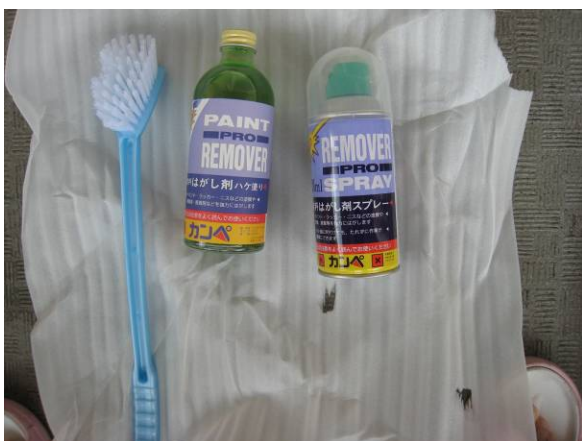
写真17 市販されている、塗料剥がし液とブラシ

屋根の瓦やアスファルトなどには、セシウムがへばり付いており、簡単な剥離操作では除去率がよくない傾向がある。そこで、市販されている「塗料剥がし液」を汚染材質に塗布してブラシで擦り剥がし液が泡立ってきたところに、PVA (デンプン) +寒冷紗を実施すると、除去効果は大きくなる。