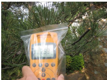
写真31 マツの放射線測定

(2) 3月15日の段階で、葉を付けていた常緑樹（とくに住宅地の近くの松、杉、ヒノキ、カイヅカイブキなど）は、放射能を受け止めて汚染されている可能性が高いので、葉を剪定する。