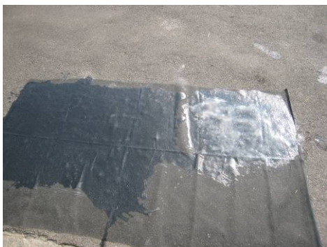
写真26 アスファルト道路表面の除染方法。

(3) 凹凸部のセシウムが強固にへばり付いている場合は、事前に湿らせたブラシで擦りゆるめてから、上記(2)の操作を行う。ブラシで擦るさいに溶剤などを使えば、効果的になる可能性もあるので、今後の研究課題である。