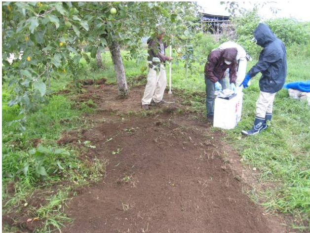
写真 2 2 青リンゴの果樹園における除染の様子。木の根っこが思わぬところにあり、注意しながら土を除去して、デンプンを混ぜて土のうに入れ、形を直方体に整える。

(2) 土をゆるめてから、寒冷紗を被せて、もう一度 P V A 液を寒冷紗の上から散布し、数時間後に乾燥してから寒冷紗を剥がす。そうすると、ゆるめた土ごと、除去できる。