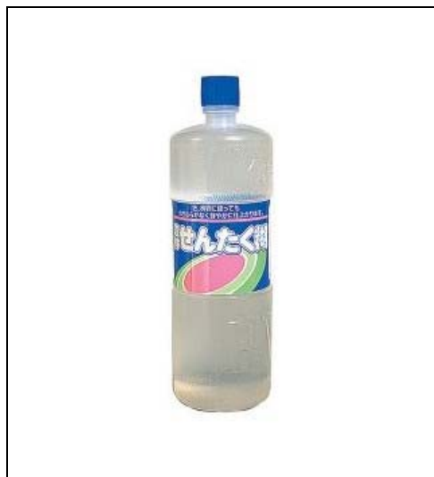
写真9 PVA＝「せんたく糊」として販売

PVA液の前に販売されていた「デンプンのり」で、現在は粉の状態で「ケイコー糊」などの商品名で販売されている。粉であるので、散布の際のハンドリングがよく、水をかけるとすぐに固まり始める。PVA液にアルファ澱粉を入れると、固まる時間が短縮されるので、場合によっては併用も考えられる。