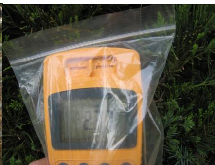
写真32 ヒノキの放射線測定

針葉樹のマツは葉っぱの面積も多く、ヤニのように粘っこいので、セシウムはなかなか離れない。