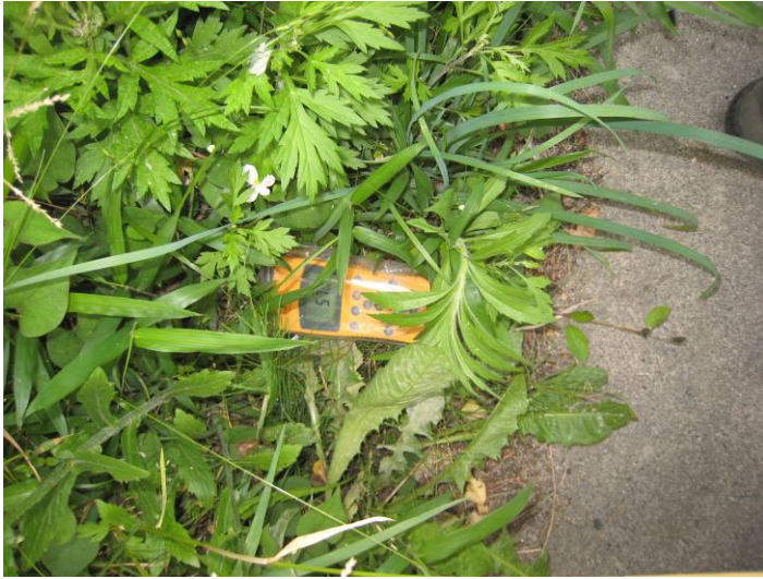
写真33 雑草もマイクロ・ホットスポットを形成している。葉っぱに付着する、根から吸収する、雨で流れてきた放射能をトラップするという3つの効果が考えられる。

(3) 樺の街路樹など、大木ほど放射能を受け止める面積が大きいため、樹木の正面や街路樹下の土壌、雑草を除染する必要がある。除染方法は「根のある土壌の除染方法」に従う。