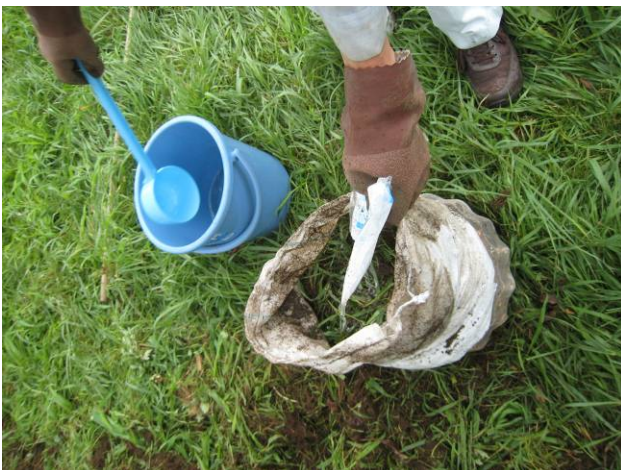
写真34 雑草と土を除去し土のうに入れてPVA液を入れて固める

(4) 芝生、雑草、コケなどは、根から除去する。除去した植物は、枝切りバサミなどで小さく裁断して土のうに入れ、PVA液を散布して、体積圧縮と直方形を形成してから、安全な場所に保管する。植物は、体積が嵩張るため、圧縮と形を整えることが、保管場所の節約のため大切である。