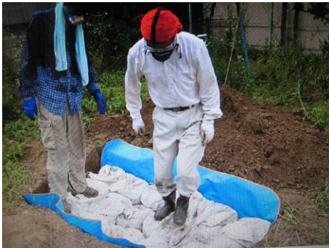
写真35 穴を掘って、ブルーシートを敷き、そのうえから土のうを、並べて配置し、無駄な空間をすくなくする。