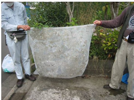
写真25 アルファ・デンプン+寒冷紗を剥がした面にへばり付いたコンクリートの剥離部分