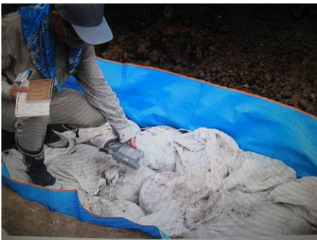
写真36 空間線量率の測定