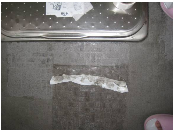
写真14 PVA膜が形成され、クッションフロアの汚れが膜に付着して除去される様子。膜を剥がした跡は、汚れが取れて綺麗になっている。乾燥を十分行って、膜が形成されていることを確認してから剥がす。剥がし残りは、布テープで簡単にとれる。