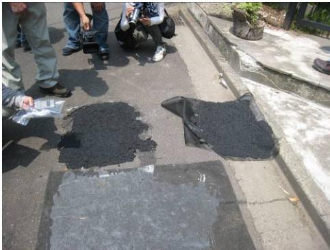
写真 27 デンプン+寒冷紗を乾燥後に剥がすと、アスファルトそのものが剥ぎ取られた様子。剥離効果が大きいことがわかる。