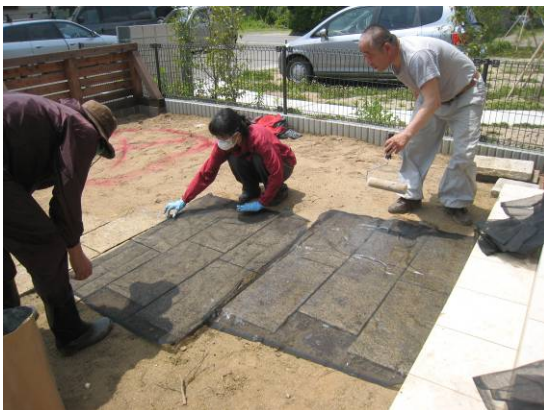
写真 28 敷石の間の雑草、コケ、汚染土壌を取り除いてから、敷石表面に寒冷紗+PVAを実施する。

(2) 敷石の間の汚染物が事前に除去された後は、敷石表面の除染を行う。この方法は、上記の「固くて凹凸のある表面材質の除染方法」に従う。この場合、アルファ澱粉は表面だけでなく敷石の間にも入れこみ、残っているセシウムを吸着させて剥ぎ取る。