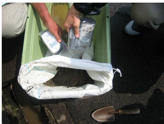
写真30 側溝汚染土壌の測定

水のある側溝においては、汚染土壌をすくい取ると、汚染水が土のうから滴り落ちてくる。それをプランターに受けてしばらく置いておくと、土壌と汚染水が分離する。土