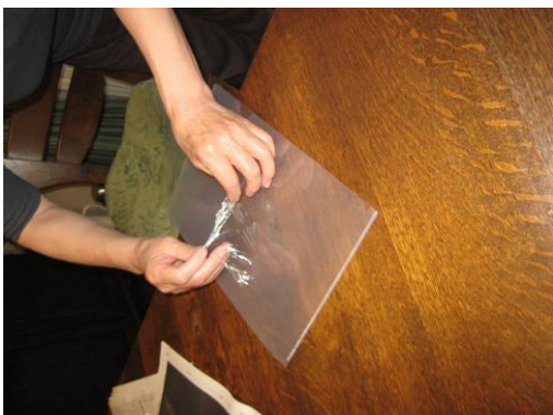
写真13 PVA液を滑らかな材質表面に垂らして乾燥させると透明の膜が形成され、それを剥がすと材質表面に付着していた汚れを除去できる。

5. 1. 5 PVA液、アルファ澱粉が固まってできた膜は、剥がし残りが生じるという指摘があるが、剥がし残りは布テープで簡単に除去することができる。