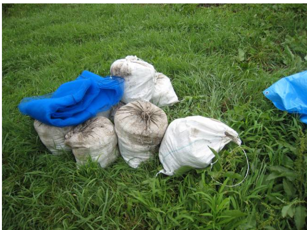
写真21 柔らかい土と雑草の混合物をデンブレンで固めて踏みつけた状態