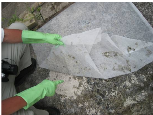
写真24 駐車場コンクリートからアルファ・デンプン+寒冷紗を剥がす。コンクリートの表面が剥離している。

(2) 上記のなめらかな表面を有する材質で、構造上傾斜がある場合工夫を要する。刷毛で塗ったPVA液が斜面に従って垂れてくるので、それを防止する為には、刷毛で塗った後から寒冷紗を被せて、垂を防止する方法をとる。寒冷紗を被せた場合、PVA液の膜の形成力が弱くなる傾向があるので、剥離力も寒冷紗を使わないときに比べて若干弱くなる。しかし、寒冷紗剥離の際の操作性はよくなる。