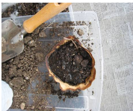
写真12 アルファ・デンプンで乾いた土を固めた様子、 PVAより硬く固まる。