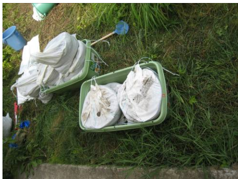
写真19 固めた液を投入した土のうをプランターに入れ、直方体の形に整える

(4) 乾燥時間を短縮して土壌除去したい場合は、アルファ澱粉、PVA液で土壌を練り上げた後、すぐに土のうに入れて踏みつけて体積圧縮、型枠へのはめ込みをして、直方体になるようにし、安全な場所へ保管する。