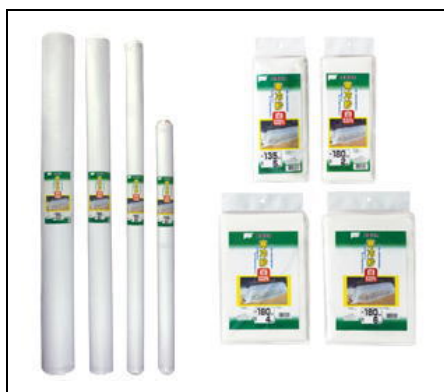
写真15 「寒冷紗（かんれいしゃ）」とは：粗く平織りにした薄い綿布を、糊付けして固く仕上げたもの。被覆資材の一種で、夏期の高温、強光による乾燥、しおれ等を防止する育苗時などに使用されるほか、防風、防虫、防鳥にも利用される。ホームセンターのガーデニング用品売場で買える。）

で剥がすという二度手間が生じる。そこで、下方に垂れることを防止し、さらに剥がし残りが生じないように、寒冷紗を使用する。