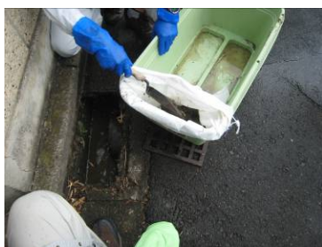
写真29 プランターに入れた土のうに側溝から汚染土壌をすくい上げ、汚染水を分離する