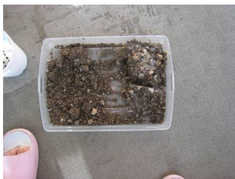
写真18 アルファ澱粉で固まった土

(2) その後に、アルファ澱粉の粉を土壌表面に散布して、上から水をかけ、表面の土とアルファ澱粉を混合させながら練る。そのまま、半日ほど乾燥させると、練った部分のみが固まり、それからスコップで除去し、土のうに入れて圧縮し、安全な場所へ保管する。