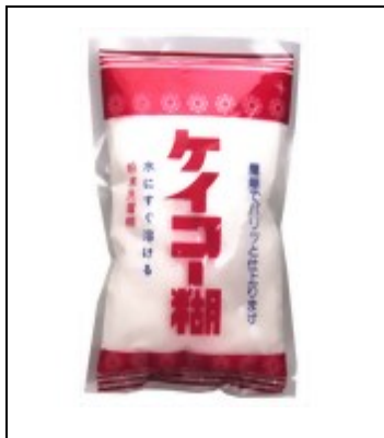
写真10 「ケイコー糊」として販売されているアルファ澱粉