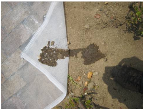
写真 2 3 緩めた土を、寒冷紗+ P V A でからめとる

(2) 土をゆるめてから、寒冷紗を被せて、もう一度 P V A 液を寒冷紗の上から散布し、数時間後に乾燥してから寒冷紗を剥がす。そうすると、ゆるめた土ごと、除去できる。