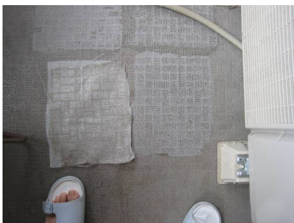
写真16 寒冷紗+PVAによって、汚れが剥がされた跡

写真15 「寒冷紗（かんれいしゃ）」とは：粗く平織りにした薄い綿布を、糊付けして固く仕上げたもの。被覆資材の一種で、夏期の高温、強光による乾燥、しおれ等を防止する育苗時などに使用されるほか、防風、防虫、防鳥にも利用される。ホームセンターのガーデニング用品売場で買える。）