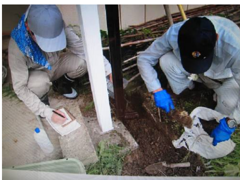
写真20 雨樋下のホットスポットをPVA液で緩めては、ちいさなスコップで土をすくい取り、土のうに入れている様子。